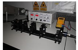
Pevnolátkový laser (Nd-YAG)

[1] Nejrozšířenější je dnes laser neodymový. Vyzářuje infračervené záření nebo zelené světlo a má uplatnění v nejrůznějších oborech, zejména v medicíně. Je využíván v léčbě 'vaskulárních nervů' , protože jeho záření se ve tkáni rozptýluje jen málo a tak proniká hlouběji, až do hloubky 2 až 6mm, kde vyvolává koagulační nekrózu. Laser může koagulovat artérie do průměru 2mm a cévy do průměru 3mm. [2] Značně rozšířený je i typ s neodymovým sklem, který může být vyroben prakticky v libovolných rozměrech a může produkovat velmi silné záření. V pulzním režimu je schopen během 10-12 s dosáhnout výkonu až 106 MW, proto se s ním počítá jako se zdrojem laserového vybuzení termonukleární reakce.