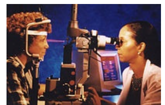
Laserová operace diabetické retinopatie

Excimerové lasery jsou nejdůležitějšími plynovými lasery pro ultrafialovou oblast. Existují pouze v excitovaných elektronových stavech (v základním stavu se jejich složky vzájemně odpuzují). Jejich záření má minimální absorpční hloubku ve tkáni, proto umožňují odstraňování mikroskopických vrstev tkáně. Tato skutečnost se využívá zejména při provádění precizních mikrochirurgických výkonů s minimálním poškozením okolí. V oftalmologii se nejčastěji používá ArF laser k fotorefraktivní keratektomii. Interakce záření excimeru s cílovou tkání se děje na principu fotodekompozice. Při tomto procesu dochází k vytrhávání molekul/ jejich shluků z cílové tkáně. [2]