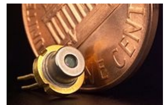
Laserová dioda v pouzdře, pro srovnání velikosti s dolarovým centem

Záření emitované LED je však generováno spontánní emisí, zatímco záření LD vzniká stimulovanou emisí. Jeho výhodou jsou malé rozměry, vysoká účinnost a integrovatelnost s elektronickými součástkami. Polovodičové lasery pracují na vlnových délkách od blízké ultrafialové do vzdálené infračervené oblasti. Výstupné výkony dosahují 2W. Všeobecně patří mezi nejpoužívanější lasery, uplatnění mají zejména v telekomunikacích , ve výpočetní technice ale i v medicíně .