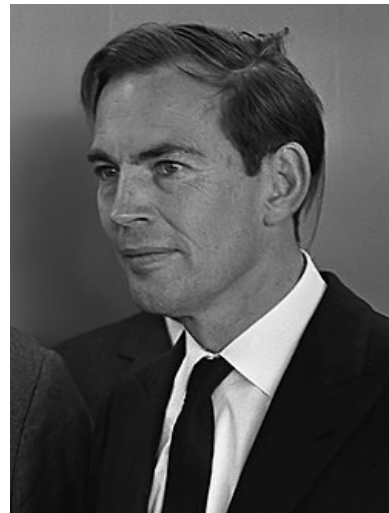
Christiaan Neethling Barnard - první člověk, který provedl transplantaci srdce

Provádí se spirometrie a zejména spiroergometrie, která vypovídá o tom, jaká je prognóza pacienta, pokud se neprovede transplantace. (Prognóza kratší než 1 rok je jedním z indikačních kritérií.) VO_2 max \leq 10 ml/kg/min. vypovídá o špatné prognóze, ovšem ještě lépe poskytuje informaci vývoj tohoto parametru v čase.