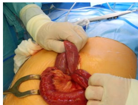
Volvulus tenkého střeva.