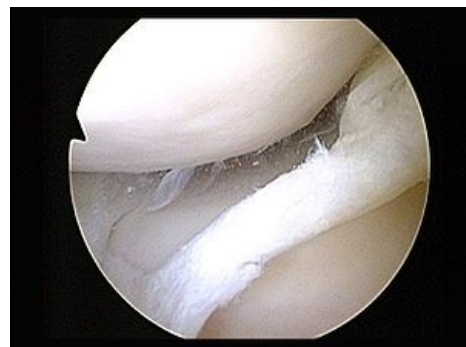
Ruptura mediálního menisku