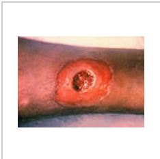
Otevřená rána (difterie)