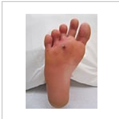
Infikovaná bodná rána