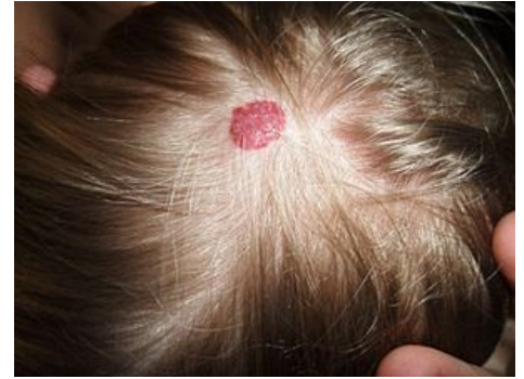
Hemangiom na vlasaté části hlavy

Hemangiomy se mohou vyvinout kdykoli během prvních měsíců života. Jsou přítomné u 10 % dětí v jednom roce věku. Dětské hemangiomy mají tendenci k vymizení - 50 % zanikne do 5 let věku, 90 % do 10 let věku. V místě hemangiomu může následně vzniknout atrofie, teleangiektázie, hypopigmentace či jizva. Mnohočetné kožní hemangiomy mohou být doprovázené hemangiomy jater a trávicího traktu s rizikem obstrukce či krvácení. Vzácně vedou rozsáhlé a mnohočetné hemangiomy k srdečnímu selhání na podkladě velkého srdečního výdeje. [1]