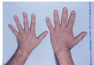
Ruka pacienta s akromegalii