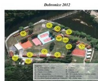
Plánek výcvikového střediska UK Dobronice

Foursquare ( http://4sq.com/nazsXW ) | Google maps ( http://www.google.com/maps?q=St%C3%A1dleck%C3%A1%20osada%20Li%C5%A1ka%20u%20Bechyn%C3%A9 )