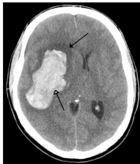
Akutní typické (hypertenzní) krvácení do bazálních ganglií (prázdná šipka) a okolní edém (plná šipka).