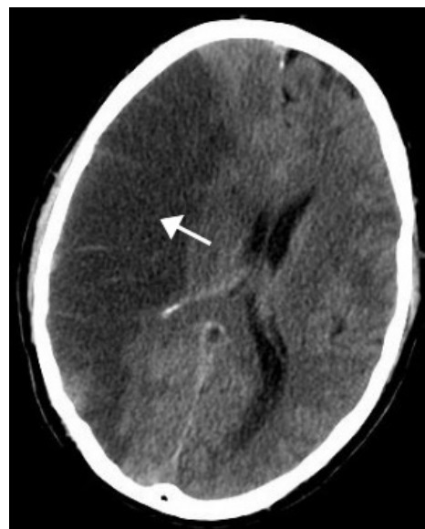
Infarkt a. cerebri media dx.

Mezi následnou dlouhodobou terapií patří např. rehabilitace, logopedie, ergoterapie nebo lázeňská péče. Dále mohou být využity služby specialistů jako jsou neuropsychologové.