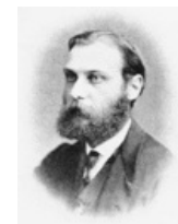
Walther Flemming (1843–1905)