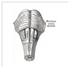
Prodloužená mícha z ventrální strany

Dorsální plocha prodloužené míchy je taktéž vyklenuta ve dva hrbolky – tuberculum gracile et tuberculum cuneatum . Obsahují stejnojmenná jádra, která jsou konečnou stanicí míšního fasciculus gracillis a cuneatus , které vedou hlavní senzitivní dráhy mozku. Dráhy se zde přepojují a pokračují dále do vyšších etáží mozku. Prostředkem oblongaty probíhá canalis centralis , který se kranálně rozevírá do IV. komory mozkové. Z prodloužené míchy odstupují tyto hlavové nervy – IX, X, XI a XII. [1]