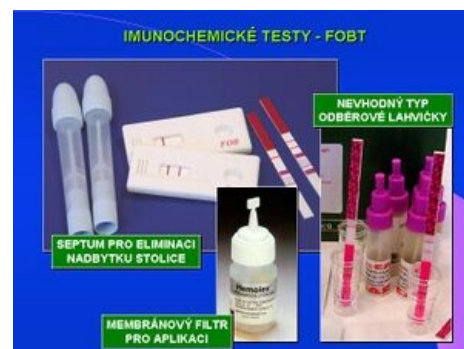
Imunochemické testy - FOBT