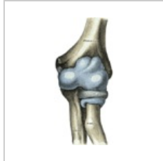
Kloubní pouzdro loketního kloubu – pohled zepředu