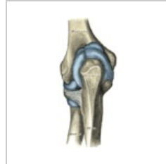
Kloubní pouzdro loketního kloubu – pohled zezadu