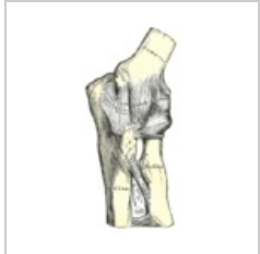
Articulatio cubiti zepředu