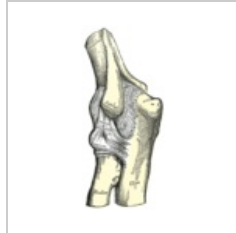
Articulatio cubiti zezadu