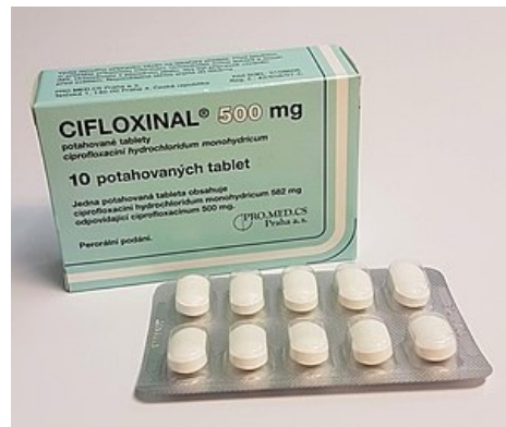
Cifloxinal®, hromadně vyráběný léčivý přípravek s ciprofloxacinem pro perorální podání

Eliminaci zpomaluje pouze výrazně snížená renální clearance, úprava dávky většinou není nutná. Interakce: významně zpomaluje metabolismus teofylinu (vždy je nutná kontrola plazmatických koncentrací teofylinu, případně volba jiného antibiotika). Indikace: široké jako u ofloxacinu - infekce močových cest, enterokolitidy všeho druhu, břišní tyfus, cholera, pseudomonádové infekce.