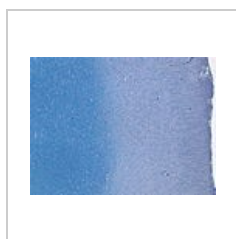
Luxolová modř, průkaz myelinu