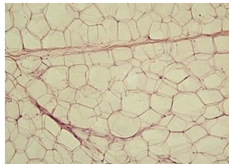
Bílá tuková tkáň