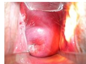
Čípek ženy po dvou vaginálních porodech

Čípek děložní se vyklenuje do pochvy a je tedy dobře přístupný pro kolposkopii. Na jeho povrchu rozlišujeme přední a zadní pysk, které ohraničují zevní branku děložní ( ostium uteri externum ). Ta má u děvčátek, dospívajících a u žen po porodu tvar příčné šterbiny, zatímco u dospělých žen, které ještě nerodily, má tvar důlkovitý.