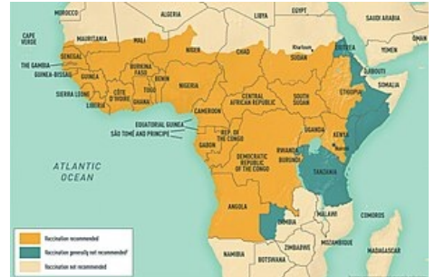
Výskyt žluté zimnice v Africe v roce 2009

Medscape 232244 ( https://medicine.medscape.com/article/232244-overview )