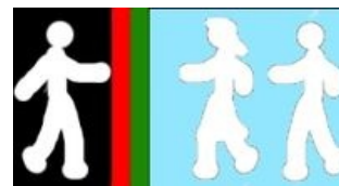
Sociální fobie (strach z mezilidského kontaktu)