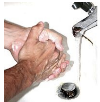
Opakované mytí rukou u pacienta s mysobíí (strach ze špíny)