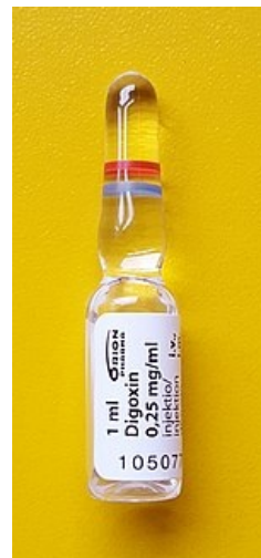
ampule 0,25mg digoxinu

U digoxinu a jiných látek této skupiny je velmi malé rozpětí mezi terapeutickou a toxickou dávkou. Doporučení na základě výsledků z observačních studií jsou taková, aby plazmatická koncentrace nepřekročila 2 ng/ml . Pro pacienta s normální hmotností a se sinusovým rytmem je vhodná denní dávka 0,125 mg. Digoxin je z těla eliminován ledvinami, a proto se u pacientů s renální insuficiencí musí podat dávka nižší [3] .