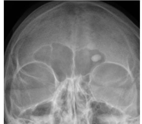
Osteom frontálního sinu