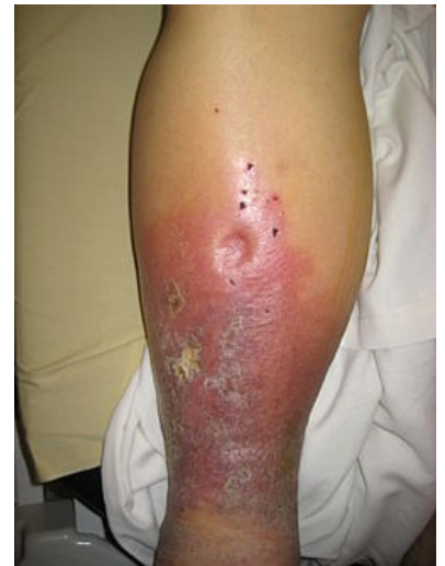
Pitting edema na bérce u pacienta s jaterním selháním.

Citováno z „ https://www.wikiskripta.eu/index.php?title=Pitting_edema&oldid=409411 “