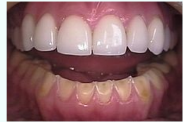
Orální manifestace bulimie