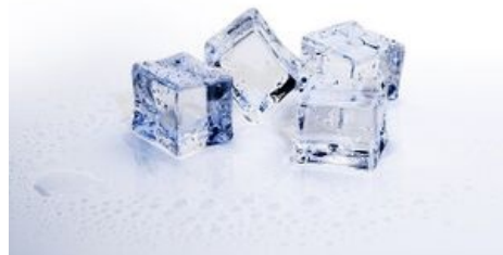
Led - pevné skupenství