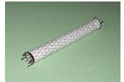
Grafted-stent (8 mm; používaný pro léze aa. iliacae)