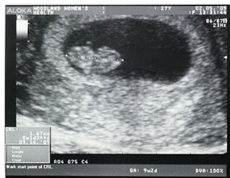
Ultrazvuk osmitýdenního plodu