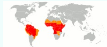
Mapa endemických oblastí žluté zimnice (červená) a oblastí s potenciálním rizikem žluté zimnice (oranžová), r. 2010