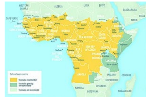
Výskyt žluté zimnice v Africe v roce 2009