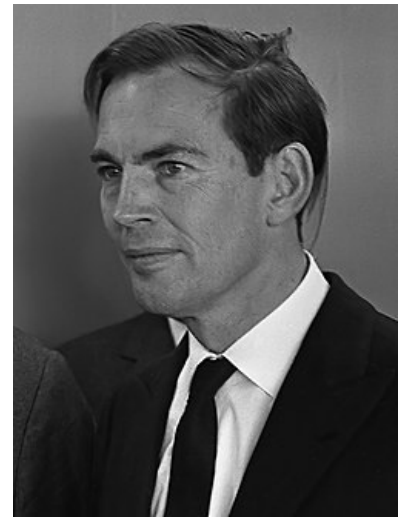
Christiaan Neethling Barnard - první člověk, který provedl transplantaci srdce