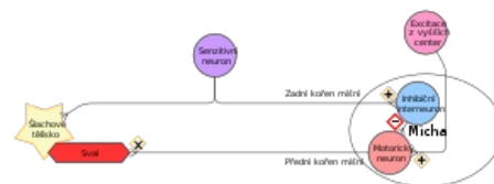
Schéma reflexního oblouku šlachového vřeténka