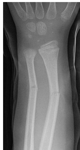
Zlomenina typu vrbového proutku - RTG