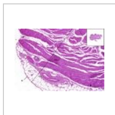
Močový měchýř- ... 783 × 540; 686 KB

Zobrazují se 3 soubory z celkového počtu 3 souborů v této kategorii.