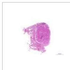
Štítná žláza, HE, 0... 783 × 540; 223 KB