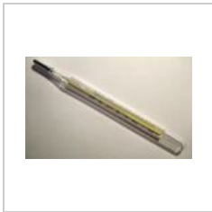
Clinical thermom... 800 × 495; 71 KB