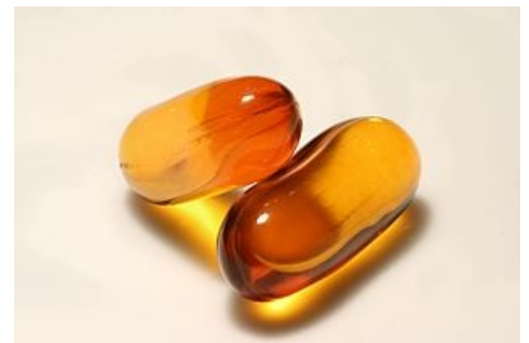
Rybí olej - zdroj Omega-3 mastných kyselin

Imunodeficitem je provázána proteinová malnutrice . Vztah hladomorů a infekcí byl přítomen historicky, proto se testuje řada látek pocházejících z proteinů v jejich vlivu na imunitu. Využití glutaminu, argininu a taurinu má málo doložené klinické výsledky. Toto použití má spíše teoretickou logiku, viz enterální výživa. Glutamin je důležitou aminokyselinou metabolismu purinů a pyrimidinů. Arginin je substrátem pro NO syntetázu a NO má imunomodulační význam v zánětlivých a antiinfekčních funkcích. Taurin se nachází ve velkých koncentracích v buňkách účastnících se zánětu, jako jsou například polymorfonukleáry. Nedostatek železa snižuje baktericidní funkci fagocytů, ale i vysoké hladiny železa mohou mikroorganismy využívat ve své virulenci. Deficit zinku je spojován s mykózami a slizničními infekty.