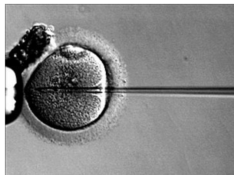
Intracytoplazmatická injekce spermie