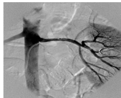
Selektivní angiografie a. renalis po proběhlé PTCA