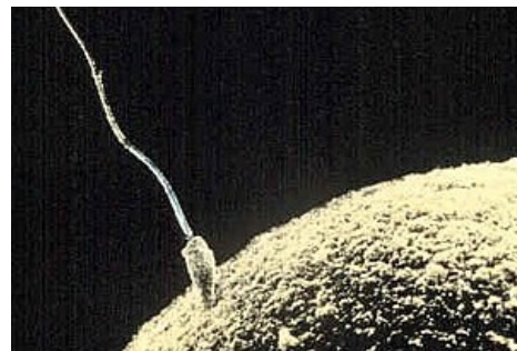
Spermie pronikající do vajíčka

Bez fertilizace by oocyt degeneroval do 24 hodin po ovulaci.