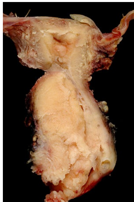
Spinocelulární karcinom děložního hrdla