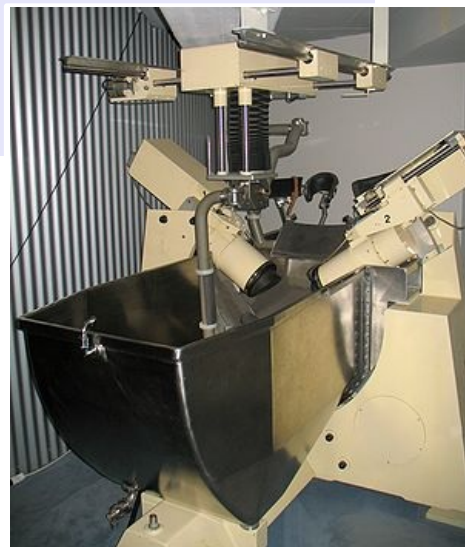
Historicky první komerčně dostupný litotryptor Dornier HM1