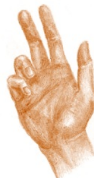
Přisahající / žehnajíc ruka (flexe prstů)

Vyřazením m. pronator teres dochází k nemožnosti pronace předloktí. Další obtíž je při flexi 2. a 3. prstu (vyřazení flexorů prstů). Flexe 4. a 5. prstu bude zachována díky inervační výjimce m. flexor digitorum profundus . Takový obraz obrny se nazývá přisahající ruka (preacher's hand).