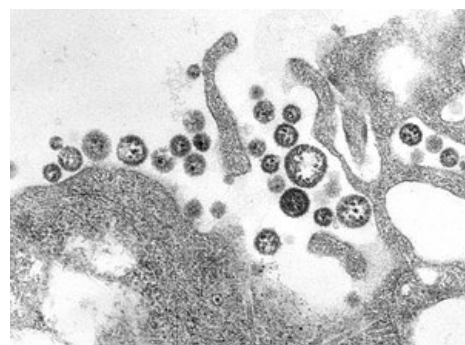
Lassa virus - jeden z virů rodu Arenaviridae (malé černé tečky)