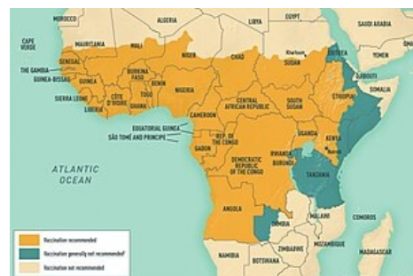
Výskyt žluté zimnice v Africe v roce 2009