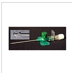
Jehla katetru s novými bezpečnostními prvky.