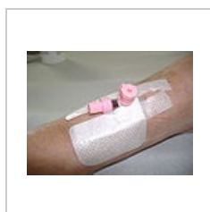
Zavedený katetr připravený k použití.