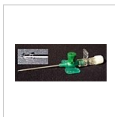
Jehla katetru s novými bezpečnostními prvky.