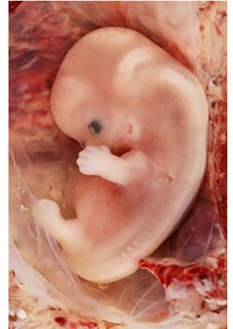
Lidské embryo staré 9 týdnů

Jako známky života je chápána přítomnost srdeční akce, pulzace pupečníku, dýchací nebo jakékoli spontánní pohyby .