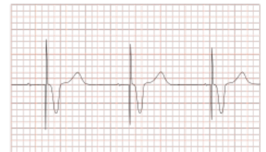
EKG-obraz pacienta s pacemakerem