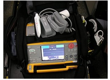
Přenosný manuální externí defibrilátor

Elektrická verze se klasicky provádí u poruch srdečního rytmu, které vznikají v srdečních síních (tzv. supraventrikulární arytmie ). Nejčastěji se jedná o fibrilaci nebo flutter síní a jiné supraventrikulární tachyarytmie. Ve většině případů se provádí elektivně za krátkodobé hospitalizace či ambulantně. Je urgentně indikována i u supraventrikulárních tachyarytmií doprovázených hemodynamickou nestabilitou, kdy je předpoklad, že vyvolávající příčinou této nestability je právě probíhající arytmie. Tyto situace je ovšem nutné vždy pečlivě zhodnotit, včetně možného rizika tromboembolie. Elektrickou kardioverzi lze také provést u hemodynamicky nevýznamné setrvalé monomorfní komorové tachykardie. [1]