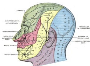
Inervační oblasti větví n. V