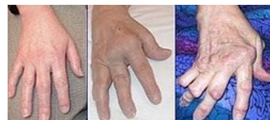
Revmatoidní artritida ruky