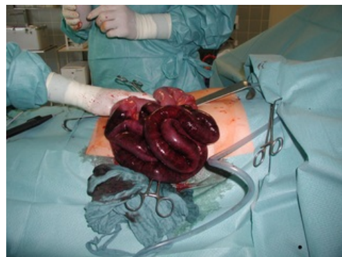
Chirurgická léčba ileu