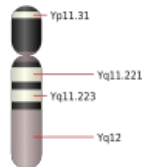
Lidský chromozom Y