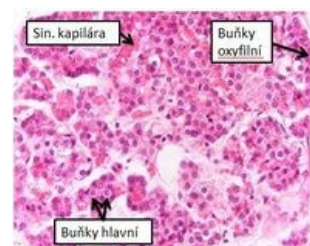
Mikroskopická stavba příštítných tělísek