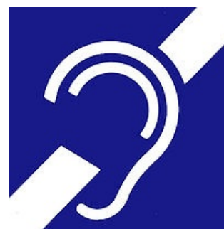
Mezinárodní symbol hluchoty

Centrální nedoslýchavost vzniká v důsledku poškození na úrovni II.-IV. neuronu sluchové dráhy . Povaha poškození je rozmanitá, vždy závisí na lokalizaci a velikosti léze, nejčastěji se jedná o trauma nebo tumor . Proto často s nedoslýchavostí pozorujeme fokální neurologický deficit . Klinický obraz nás může někdy svádět na „falešnou“ stopu fatické poruchy nebo poruchu intelektu.