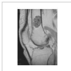
Enchondrom femuru MRI