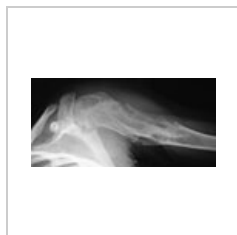
Ollierova choroba – Mnohotné enchondromy ve proximálním humeru

Zvláštním nádorem z chrupavčité tkáně je chondrohamartom . Vzniká typicky subpleurálně v plicích z odštěpených kmenových buněk nezapojených do okolní tkáně (hamarcie). Mikroskopicky jej tvoří dobře diferencovaná chrupavčitá tkáň s komůrkovými buňkami, na periferii je příměs dalších tkání (respirační epitel, hladká svalovina, tuková tkáň). Nádor je řazen mezi benigní, avšak s určitým rizikem malignizace.