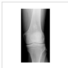
Enchondrom femuru RTG